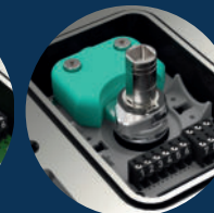
doppelsensor dual sensor