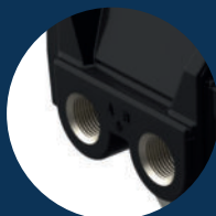
2x M20x1,5 4x M20x1,5