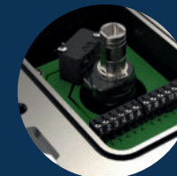
mechanisch mechanical SPDT/DPDT