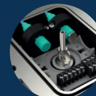
zylindrisch induktiv/reed cylindrical proximity/reed