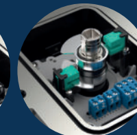
schlitz slot type