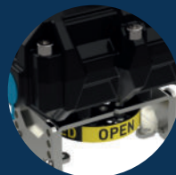
unter der Box below the box