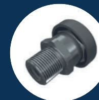
membran venting element