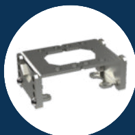
MBHX (80,82 mm) 1.4301 / AISI 304 verstellbar adjustable