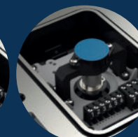
winkelsensor angle Sensor 4-20 mA