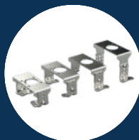
MBH (F05) 1.4301 / AISI 304 verstellbar adjustable