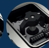
potentiometer potentiometer 5k Ohm